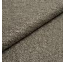
Audinys Marlon 81E6 Taupe 1021803