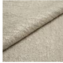
Audinys Marlon A3R1 Sand 1021804