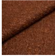
Audinys Marlon 8457 Rust 1021809