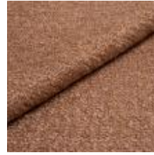
Audinys Marlon 42Z7 Pink 1021811