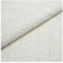
Audinys Marlon A6Q3 Off white 1021801