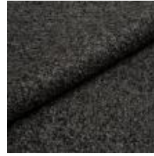
Audinys Marlon G2G3 Chestnut 1021805