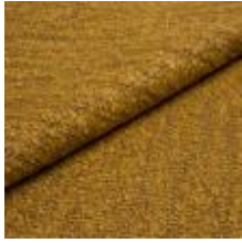
Audinys Marlon G3C2 Gold 1021808