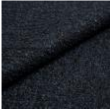
Audinys Marlon 02W6 Midnight 1021807