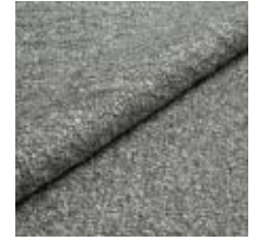
Audinys Marlon B3T6 Concrete 1021806