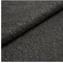
Audinys Marlon G4BD Mole 1021802